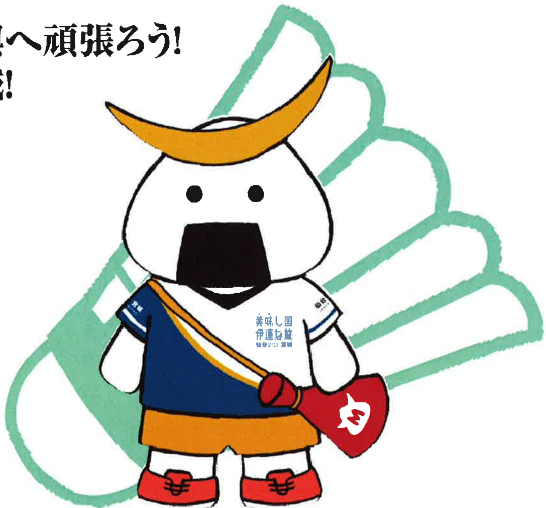
宮城県観光PRキャラクターむすび丸